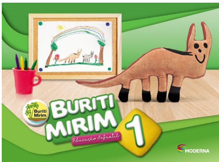
Buriti Mirim, 1. Editora Moderna